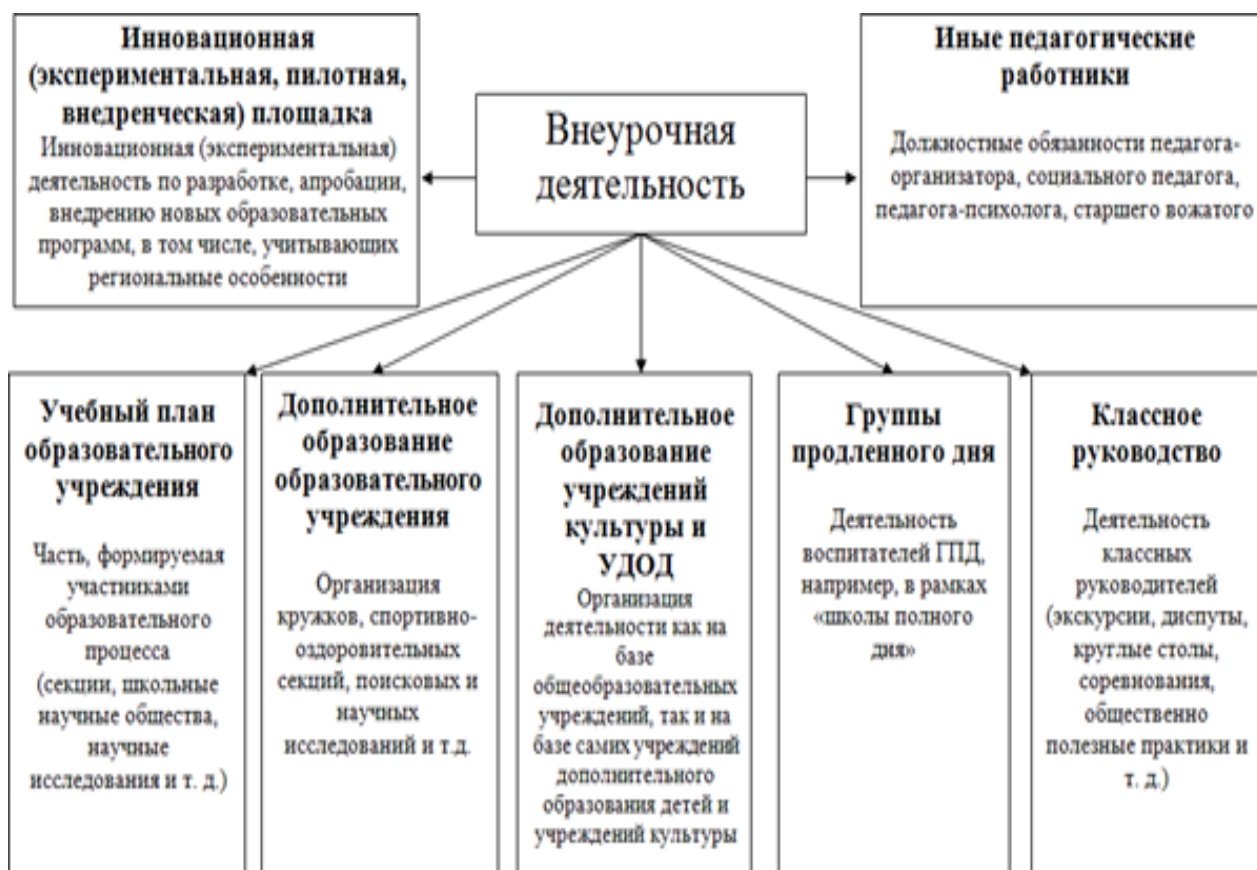
Рис. 1. Базовая организационная модель реализации внеурочной деятельности

Чтобы представить организационную модель в качестве основной (базовой) в наиболее кратком и доступном виде, изобразим ее, исходя из задач, форм, содержания внеурочной деятельности, создав условия для профессионального самоопределения обучающихся (рис. 1).